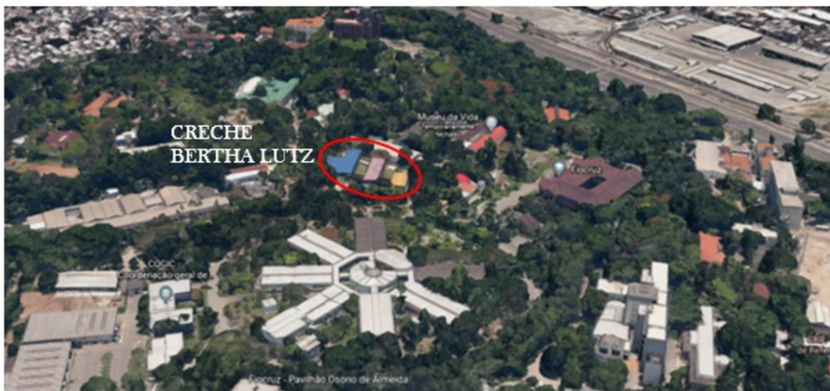
Figura 1: Demarcação e localização do terreno do Campus Fiocruz-RJ e Expansão..

A sede da Fiocruz Rio de Janeiro está localizada na Avenida Brasil 4.365, Manguinhos, Rio de Janeiro – RJ, CEP: 21.040-360.